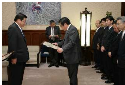
副議長認証授与式

5月定例会で大阪府議会副議長に推挙され、就任いたしました。安全・安心の町、活気溢れる大阪をめざして頑張っております。今後ともご導ご鞭撻を願います。