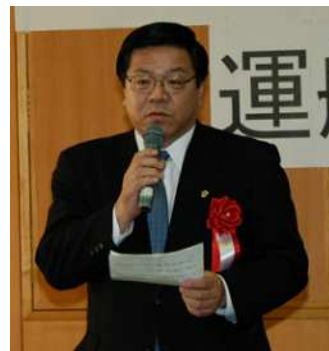
運行開始式で挨拶する西村議員

ことを願っている。今後もさらなる救急医療の充実に取り組みたい。」と抱負を述べました。